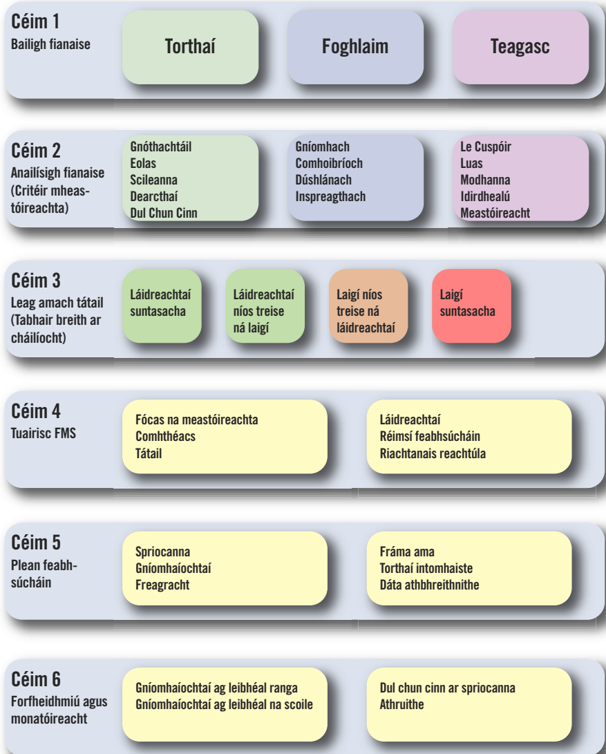
Figiúr 2. AN PRÓISEAS SÉ CHÉIM UM FHÉIMHEASTÓIREACTH SCOILE

Tugann Figiúr 2 níos mó sonraí faoi na sé chéim atá sa phróiseas FMS. Is feidir úsáid a bhaint as na céimeanna seo chun scrúdú, nó tuarisciú nó feabhsú a dhéanamh ar aon ghné d’obair na scoile ar bhealach córasach.